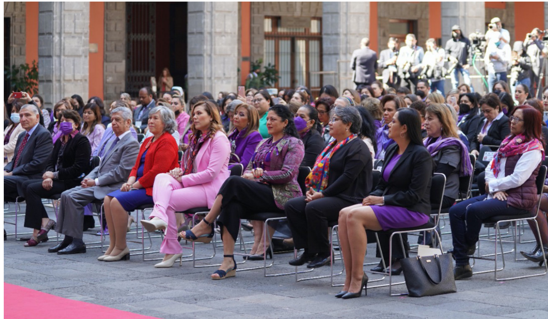
Asistentes en la Ceremonia conmemorativa del “Día Internacional de las Mujeres”.