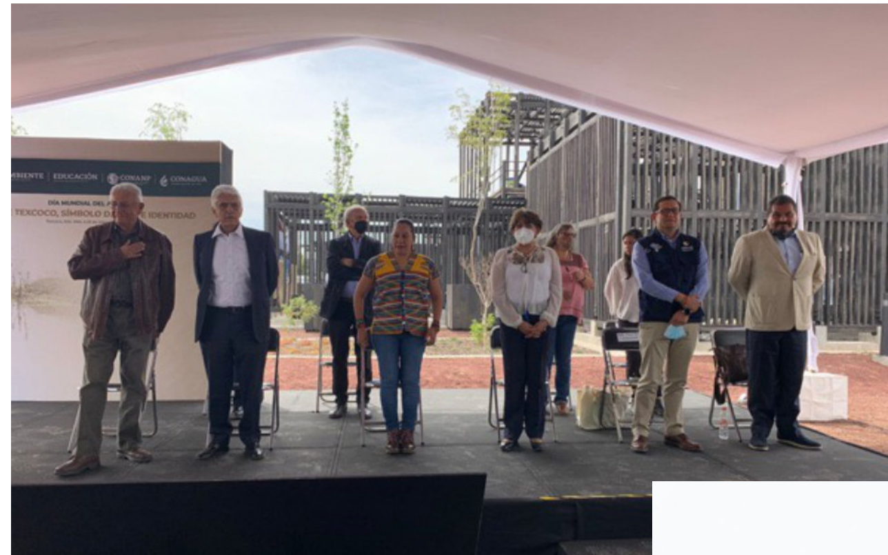
El Procurador Agrario, Luis Hernández Palacios Mirón, en la ceremonia conmemorativa del "Día Mundial del Agua".

Se tiene el registro de 107 especies endémicas, de las cuales 50 son de flora, 28 de aves, 13 de reptiles, 10 de anfibios, 4