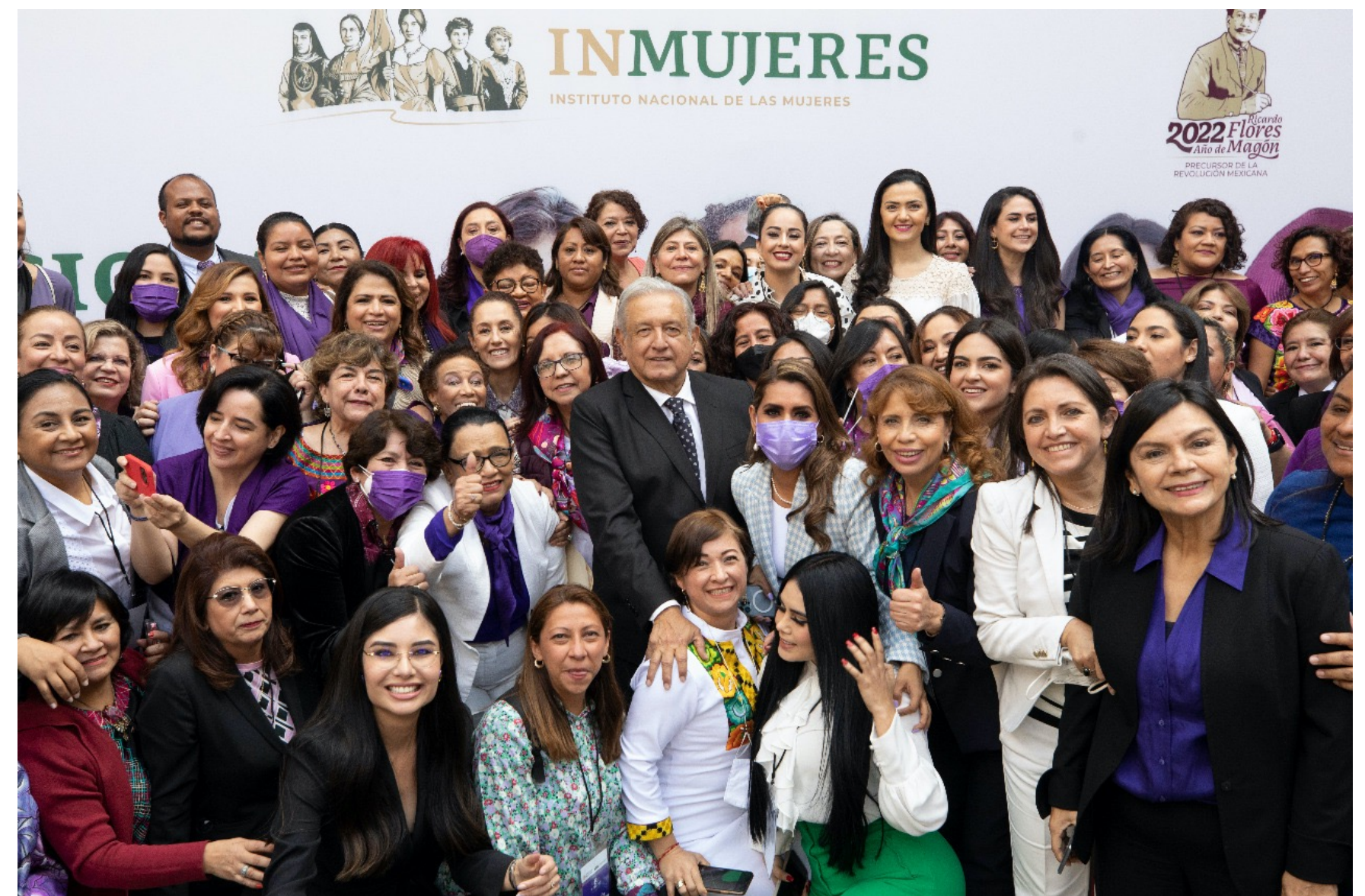
El Presidente de México, Andrés Manuel López Obrador, en compañía de las mujeres líderes, presentes en la ceremonia conmemorativa del “Día Internacional de las Mujeres”.

La Cuarta Transformación sigue en marcha con una perspectiva de equidad de género, generando igualdad económica y social para mujeres y niñas. ■