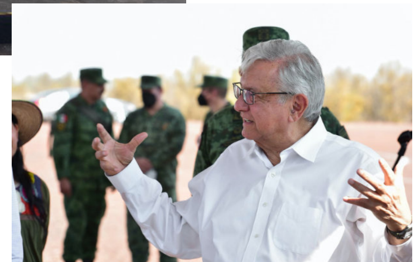
El Presidente de México supervisa la zona del Lago de Texcoco.

de peces y 2 de mamíferos. Algunas especies endémicas y con categoría de riesgo de acuerdo a la NOM-059-SEMAR-NAT-2010 son el apaclol, falso maguey grande, garambullo y cedro; de fauna está la rana de árbol plegada, ajolote de arroyo, lagarto alicante cuello rugoso y el rascón real.