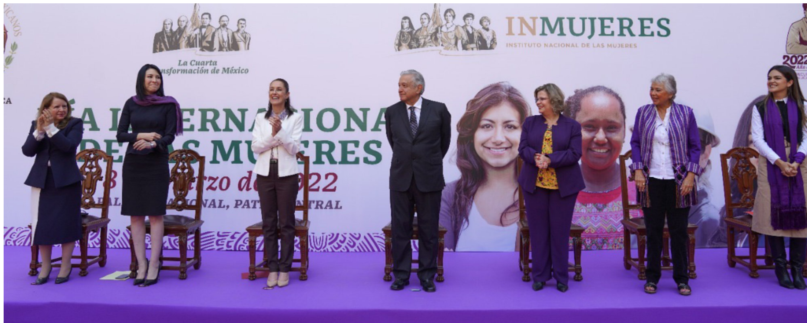
El Presidente de México, Andrés Manuel López Obrador, encabezó la ceremonia del Día Internacional de las Mujeres en Palacio Nacional.