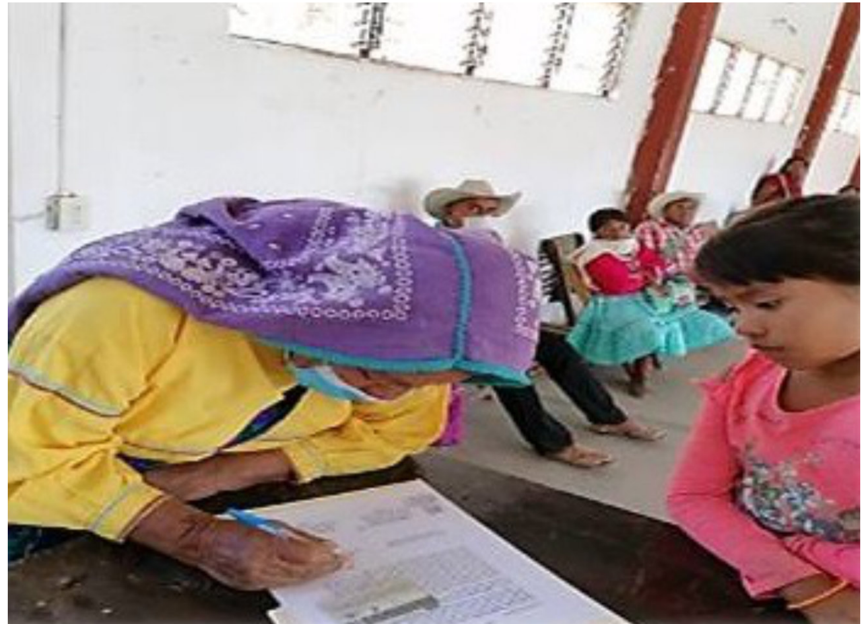
Las mujeres rurales, en sus derechos individuales y colectivos.

Para la Procuraduría Agraria, esta reforma responde, en estricto sentido, a la política agraria que impulsa el Gobierno de la Cuarta Transformación, así como a los ejes sustantivos de su Programa Institucional 2020-2024, que tiene como principios rectores la defensa de los derechos agrarios, reducir las brechas de desigualdad de mujeres; garantizar certeza jurídica a la propiedad social; preservar ecosistemas, y contribuir al desarrollo social y sustentable de los núcleos agrarios.