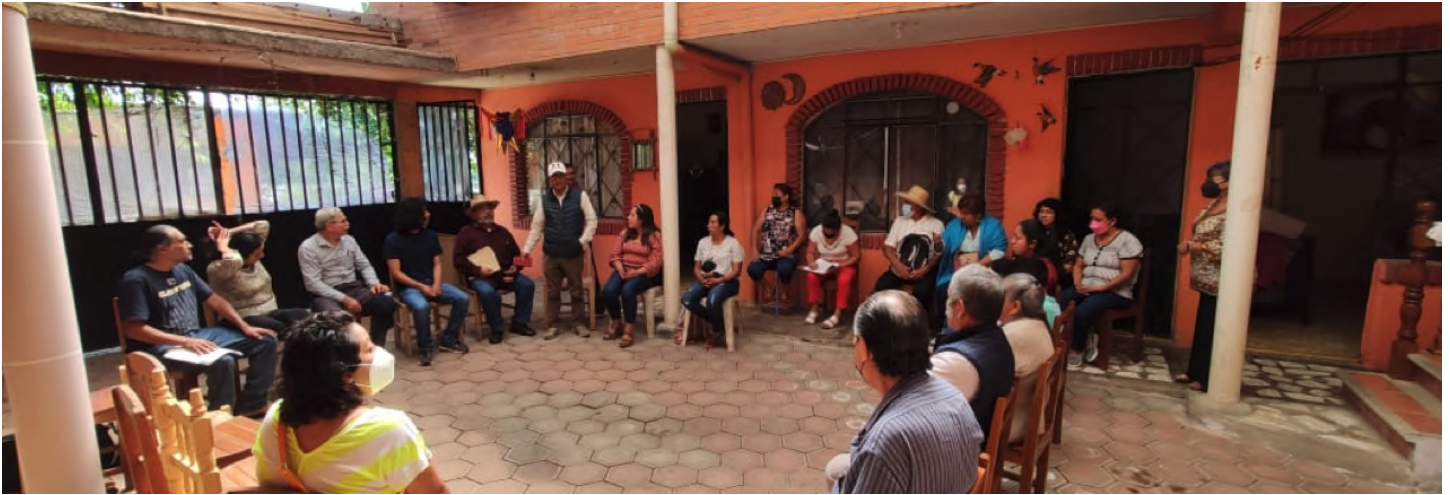
Ejercicio de diagnóstico de la cuenca del río Bobos-Nautla con participantes de comunidades de Veracruz y Puebla.

Abierto donde se expusieron propuestas concretas para modificar la Ley de Aguas del Estado de México bajo un enfoque de Derechos Humanos.