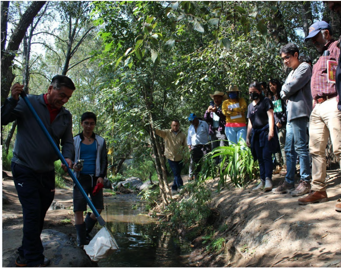
Recolección de macroinvertebrados en el río Coxcoaco, Estado de México, como parte del taller para el monitoreo de la calidad del agua. 5 de noviembre de 2022.

de las comunidades sobre los bienes de su territorio y establezca la responsabilidad de las autoridades por mantener sus fuentes de abasto de agua, en una visión de largo plazo.