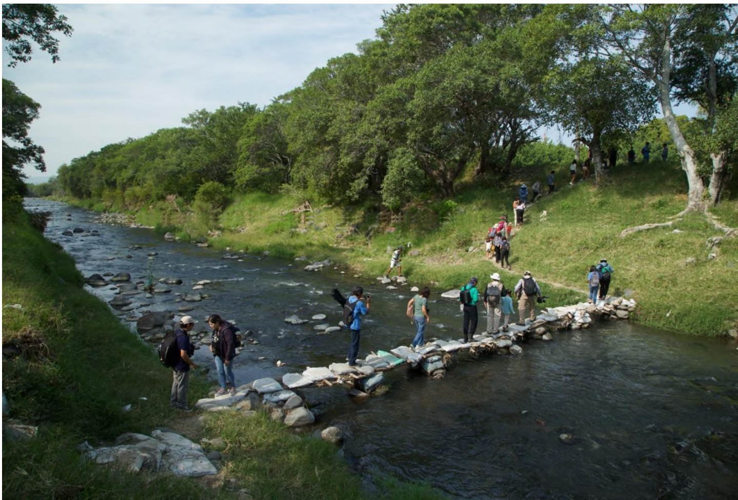
Recorrido por el río Cuautla (EcoRuta), 13 de noviembre de 2022.

En Cuautla, Morelos, se han elaborado dos folletos: uno sobre las aves que habitan el río Cuautla y otro sobre la fauna que ha sido avistada en el río. Estos materiales, además de valorizar las iniciativas de ciencia ciudadana que se realizan en la región, buscan difundir nuevos saberes de tipo naturalista, con los que hasta ahora la población no está familiarizada, y que tienen el potencial de transformar la manera en que se ve y aprehende el río, al presentarlo como un espacio de biodiversidad y bien común antes que como un recurso. Al nombrar, conocer e identificar las especies que forman parte del entorno del río, se propicia un cambio en la percepción de los cuerpos de agua y los problemas que los afectan, pues sólo se protege lo que se conoce y valora. Asimismo, se diseñaron dos