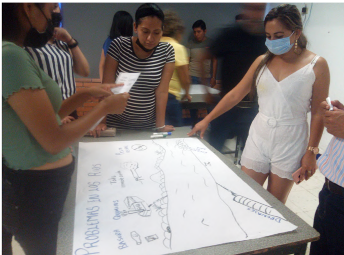
En Martínez de la Torre, Ver., las participantes analizan la problemática del río Bobos y proponen soluciones.

Abierto donde se expusieron propuestas concretas para modificar la Ley de Aguas del Estado de México bajo un enfoque de Derechos Humanos.