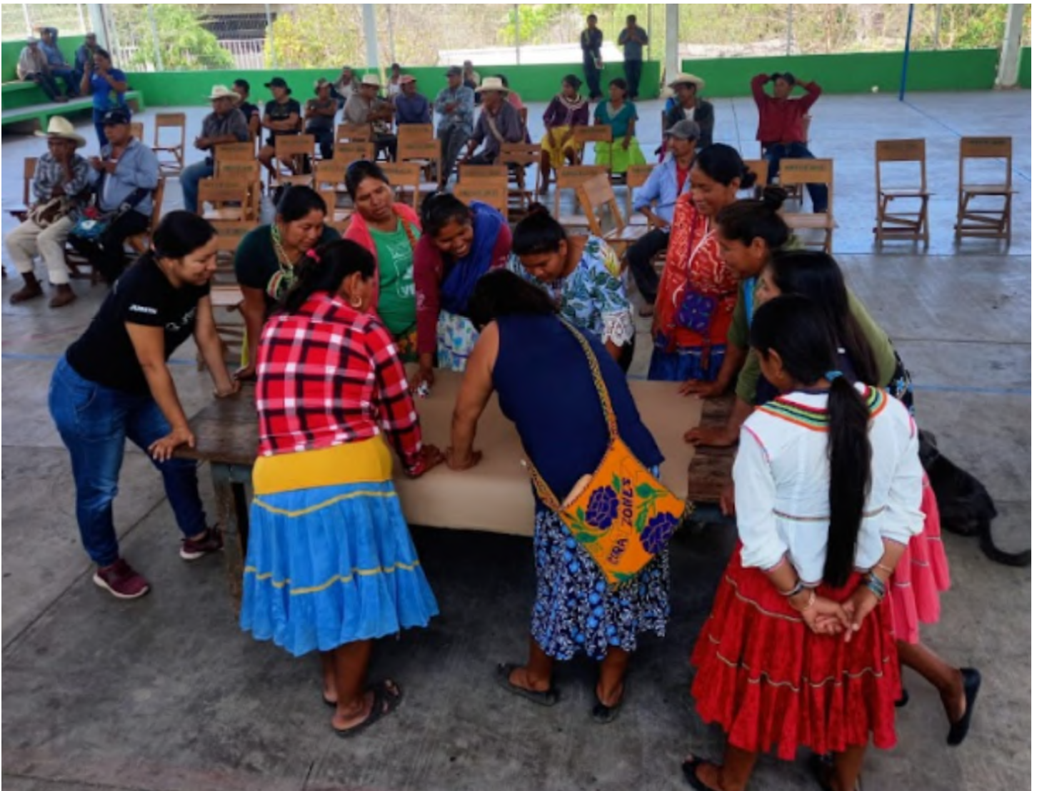
Taller participativo “Construyendo ahora el futuro que queremos”. San Juan Corapan, Rosamorada, Nayarit. 6 de julio de 2022.

Pero falta mucho en términos de coordinación intra-gubernamental: entre sectores, entre niveles, entre municipios y entre períodos administrativos. Las propuestas e ímpetus ciudadanos-comunitarios se topan con una institucionalidad poco permeable y frecuentemente las organizaciones hemos sido percibidas como una amenaza por diversos sectores de los gobiernos en turno, y por los intereses que se han creado bajo el actual paradigma.