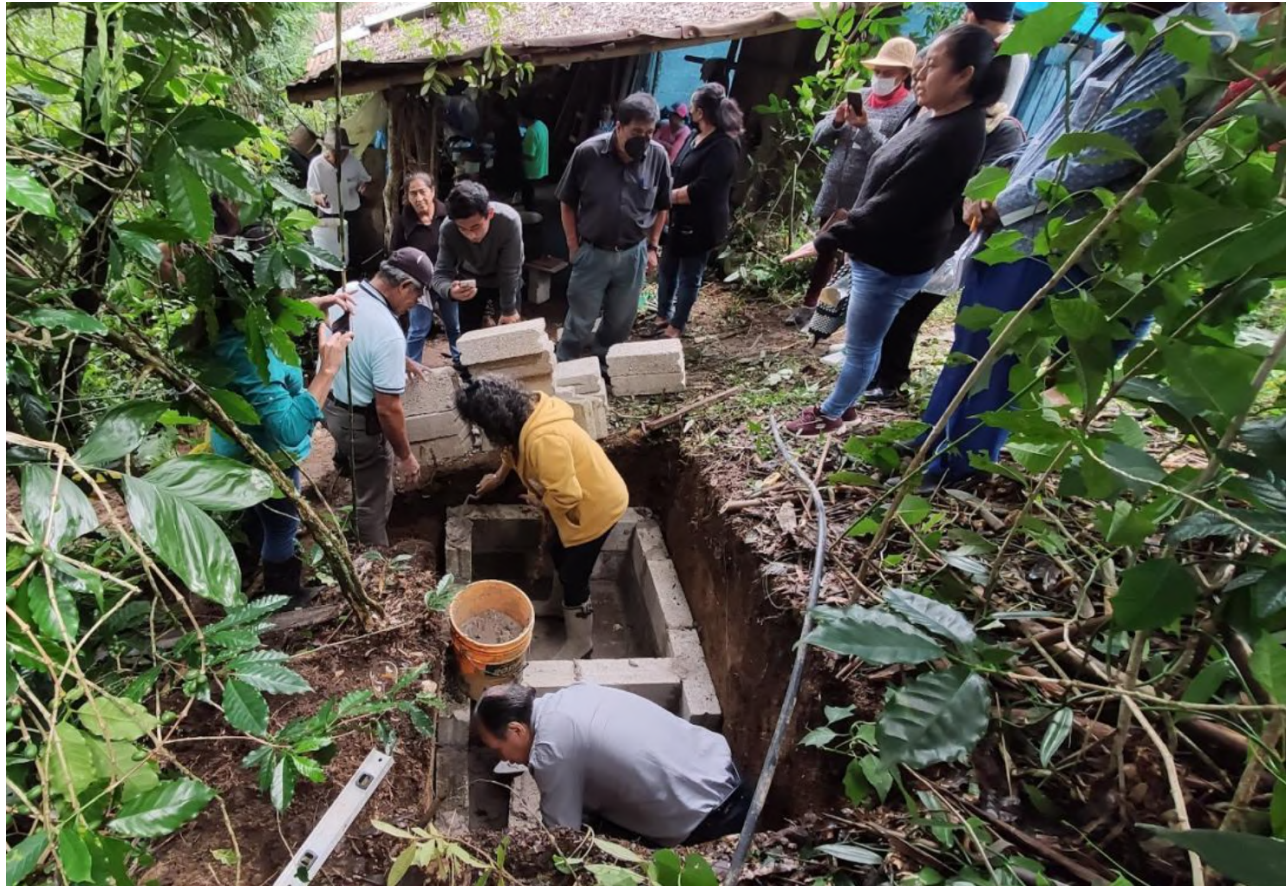
Taller de construcción de baños ecológicos secos en Hueytamalco, Puebla, cuenca alta del río Nautla.

munitarias de agua, la creación de contralorías, observatorios u otras instancias de poder ciudadano autónomo, todo ello en pos de una creciente capacidad de propuesta, negociación y presión para abrir espacios políticos en la gobernanza del agua, en la prevención y resolución de conflictos y crear o utilizar espacios de diálogo con los tomadores de decisión.