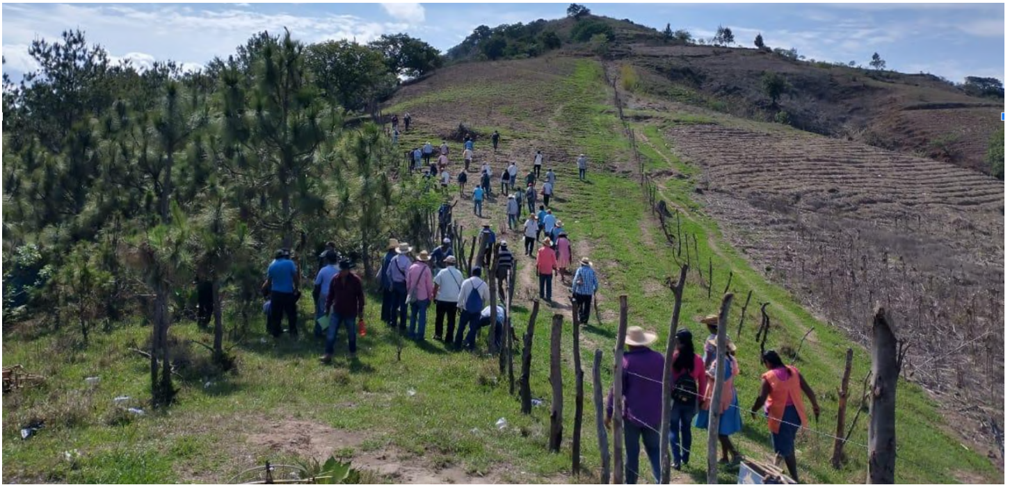
Jornada de reforestación en cabecera de microcuenca en El Jagüey, Chilapa, Guerrero.

Al acompañar, promover e impulsar cambios técnicos, organizacionales y culturales, buscamos generar cambios en los territorios de vida y fomentar la participación de las y los actores que aún no se involucran en el cuidado y reapropiación de espacios que hoy día se encuentran deteriorados o abandonados, como los ríos en las zonas urbanas. Obviamente, la transformación y reapropiación del territorio es un proceso paulatino, que requiere tiempo. Conforme vamos avanzando podemos ver señales de cambio: contribuimos a la reapropiación simbólica de los ríos, ayudando a crear vínculos afectivos con los cuerpos de agua, que se vuelven presentes en el imaginario de los actores, y que desembocan o tienden a desembocar en acciones concretas para detener el proceso de contaminación y lograr la restauración. En Xalapa, capital de Veracruz, los recorridos por manantiales y ríos de la ciudad está permitiendo atraer gente a nuestras redes, gente que se va interesando por la problemática de la gestión del agua en su ciudad y dispuesta a aportar sus habilidades y conocimientos.