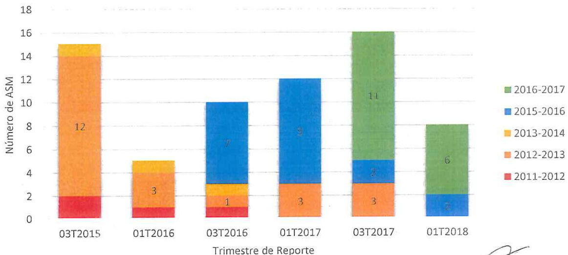
Gráfica 1. ASM Atendidos por ciclo.

Para continuar con el Orden del Día, el Presidente Suplente expuso el estatus de los Aspectos Susceptibles de Mejora (ASM). Sobre el tema, dijo que de 2015 a 2018 se incrementó la atención de ASM. En el tercer trimestre de 2015, se tenían 12 ASM del ciclo 2012-2013. En cambio, para el primer trimestre de 2018, solo se contaban con 8 ASM vigentes de los ciclos 2015-2016 y 2016-2017, los cuales fueron solventados. En la gráfica 1 se presenta el seguimiento de los ASM.