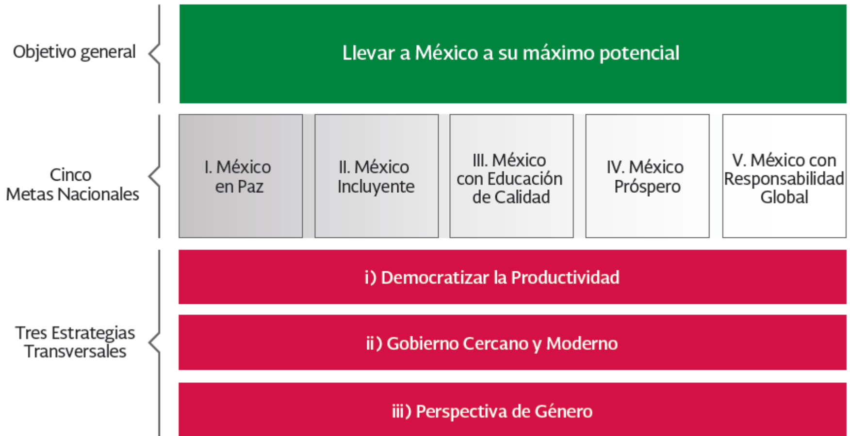
FIGURA 1.1. ESQUEMA DEL PLAN NACIONAL DE DESARROLLO 2013-2018.